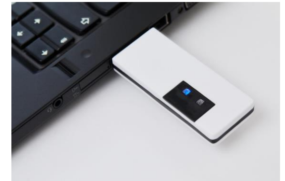
Le récepteur USB 3.0 est l'interface entre les boîtiers